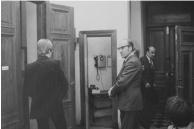
Käräjäsalin odotustila ja kansliatilat Annankadulla olivat ankeat.