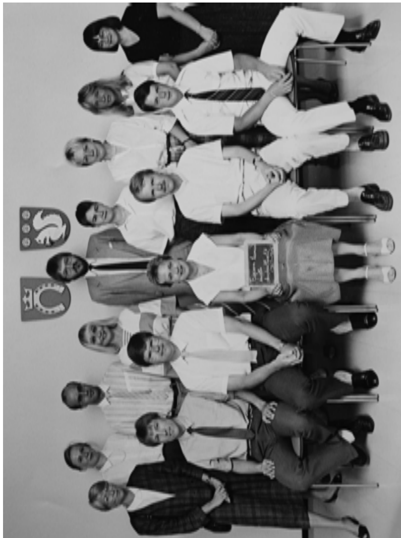
Tuomiokunnassa riitti auskultantteja. Vuosina 1985-1986 notaarina tai päätoimisena apulaisena toimineet ovat ryhmittyneet yhteiskuvaan Espoon ja Kauniainen kaupunkivaakunoiden eteen.