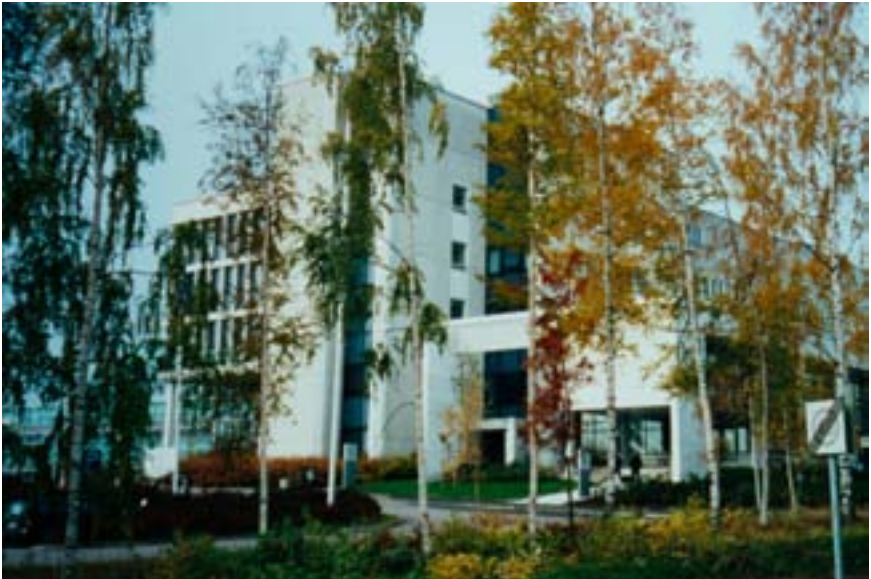
Espoon oikeustalo syksyisissä väreissään vuonna 2000.

Keväällä 1994 käräjäoikeus pääsi muuttamaan uusiin toimitiloihin Espoon Kilon muutaman kilometrin päähän Kalkkipellontien toimitiloista. Kilossa olevan ison kuusikerroksisen toimistorakennuksen omisti Instrumentarium Oy. Poliisilaitos oli puolta vuotta aikaisemmin muuttanut talokorttelin toiseen pätyyn. Näin käräjäoikeuden oikeustalo tuli sijaitsemaan samassa korttelissa poliisin kanssa. Käräjäoikeus sai kolme alinta kerrosta talon itäpäädyssä. Käräjäoikeuden katuosoitteeksi tuli Vitikka 1, 02630 Espoo.